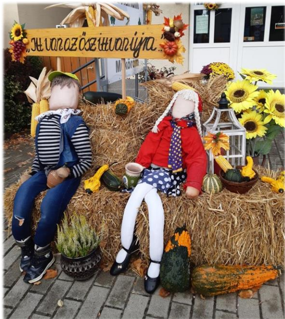
Kedves színlolt a faluközpontban, a Borostyán üzlet előtt.