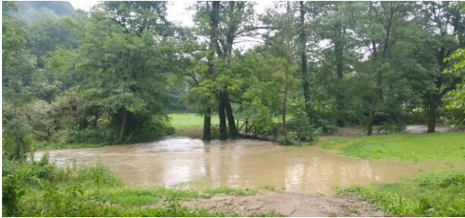
A kiáradt Gerence-patak a Tökgrúti-rét hídjánál

Július végén közös bejárást tartottunk a Magyar Közút Nonprofit Zrt. Veszprém megyei igazgatójával és munkatársával Bakonybél belterületi főútvonalán. Felmérve az út állapotát, ígéretet kaptunk arra, hogy 2017-ben, de legkésőbb 2018 elején a faluközpont belső szakasza - a Fő utcának a régi önkormányzati épület és a posta közötti része - teljes felújításra kerül.