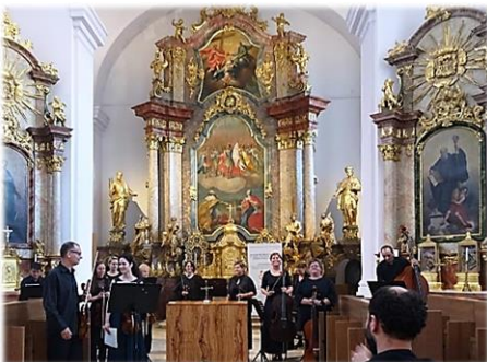
A Gödöllői Szimfonikusok koncertje