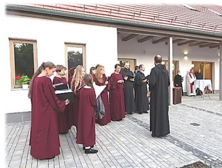
Boldog Gizella Ház avatása