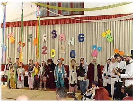
Az egyházközség farsangja