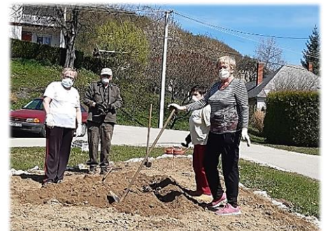
A virágosítás nem szünetel