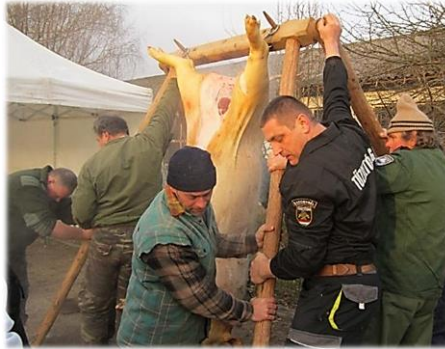
Hagyományos falusi disznóvágás