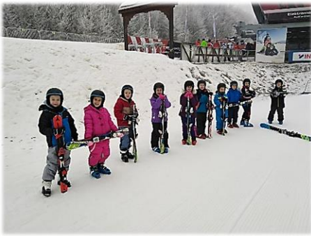
Sielni tanulnak az iskolások