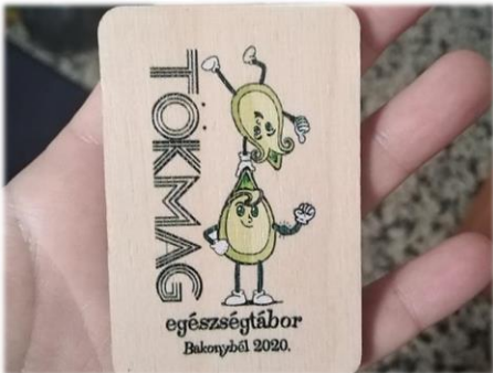
Bakonybéli gyerekek nyári tábora