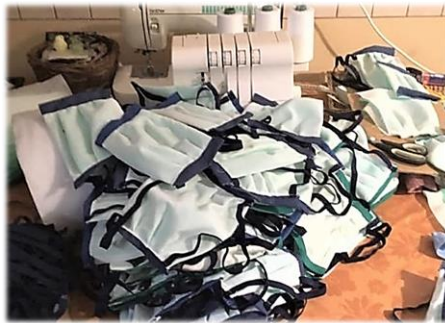
Maszkvarrás az óvodában