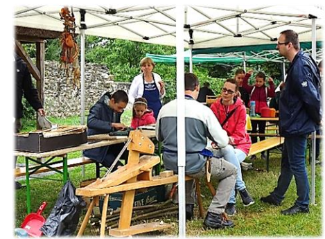
Hagyományos kézműves nap