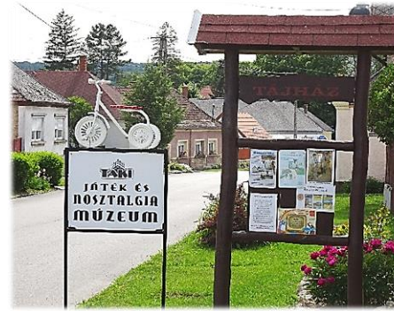
Új kiállítás nyílt a Tájházban