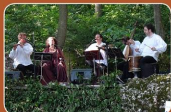
Musica Historica Régizenei Együttes